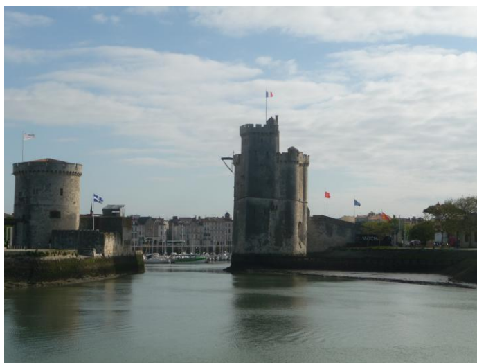
Le port de La Rochelle – 22-24 mai 2013

Un grand bravo à nos lycéens qui ont représenté notre établissement avec des projets de grande qualité et un comportement exemplaire.