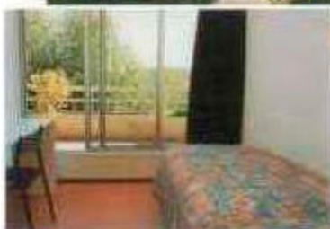
Intérieur d'une chambre